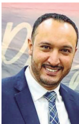
19/12 - Ver. Rafa Gente da Gente de Barueri