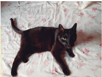
NOME: LORENZO Tutor (a): Rose Teodoro Raça: SRD Data Nascimento: 20/12/2010 Origem: Brasil