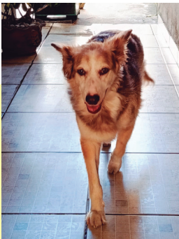
NOME: BELINHA Tutor (a): Rosemeire Raça: SRD Data Nascimento: 08/12/2012 Origem: Brasil